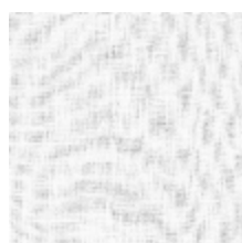
1304-01 EOLE - BLANC