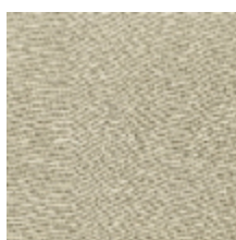
1304-03 EOLE - LIN