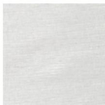
1320-01 LUMIO MI - CRISTAL *