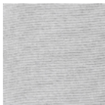
1320-02 LUMIO MI - ARGENT *