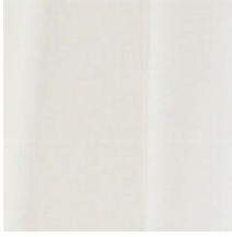
1326-55 PLEIN JOUR – CREME L420