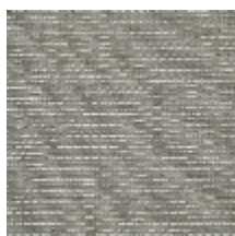
1361-02 FILAMENT - ARGENT