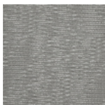
1361-03 FILAMENT - RIZ