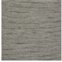
1366-01 ALLIAGE - BRONZE