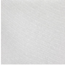
1366-02 ALLIAGE - CRISTAL