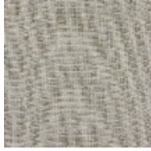
1367-03 PAPYRUS - GRES