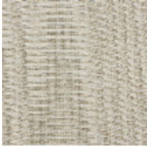
1367-02 PAPYRUS - AVOINE