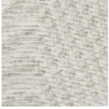
1367-01 PAPYRUS - CRAIE