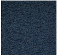
1482-07 FARNIENTE - MARINE