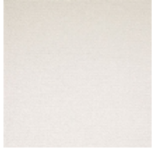
1482-01 FARNIENTE - BLANC