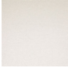
1482-01 FARNIENTE - BLANC