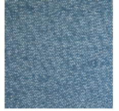
1482-06 FARNIENTE - OCEAN