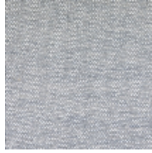
1482-04 FARNIENTE - FUMÉE