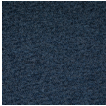
1482-07 FARNIENTE - MARINE