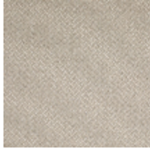
1482-02 FARNIENTE - BEIGE