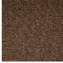
1482-03 FARNIENTE - BRUN