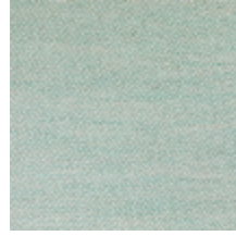
1482-05 FARNIENTE - ACQUA