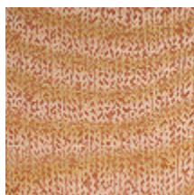
1483-09 SPLASH - PAPAYE