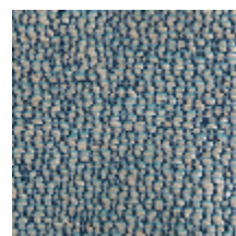
1483-05 SPLASH - OCEAN