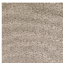
1483-02 SPLASH - NATUREL