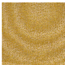
1483-08 SPLASH - SOLEIL