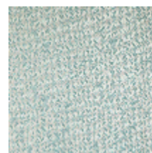
1483-06 SPLASH - ACQUA