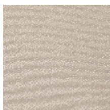
1483-01 SPLASH - NACRE