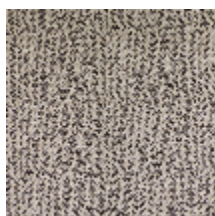
1483-03 SPLASH - GRANITE