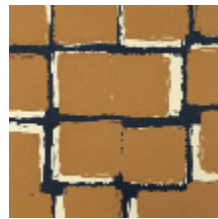
1486-05 PALETTES - CAMEL