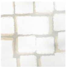
1486-01 PALETTES - NATUREL