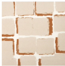
1486-03 PALETTES - POUDRE