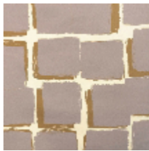
1486-02 PALETTES - TOURTERELLE