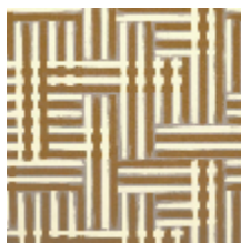
1487-02 NUANCES - TOURTERELLE