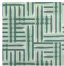
1487-04 NUANCES - CELADON