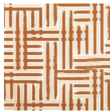
1487-03 NUANCES - POUDRE