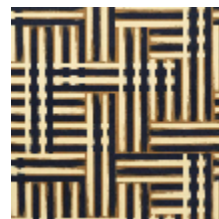
1487-05 NUANCES - CAMEL