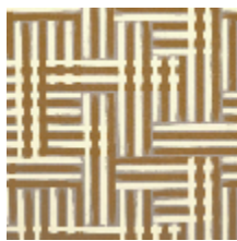
1487-02 NUANCES - TOURTERELLE