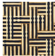
1487-05 NUANCES - CAMEL