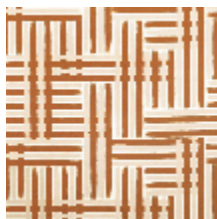
1487-03 NUANCES - POUDRE