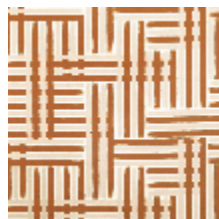
1487-03 NUANCES - POUDRE