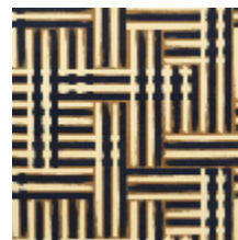
1487-05 NUANCES - CAMEL