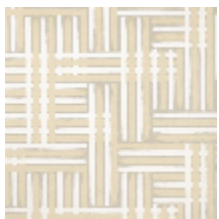
1487-01 NUANCES - NATUREL