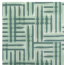
1487-04 NUANCES - CELADON