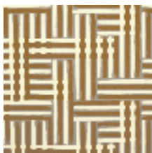
1487-02 NUANCES - TOURTERELLE