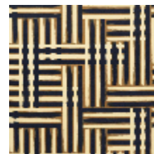
1487-05 NUANCES - CAMEL