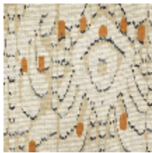
1488-01 IKATI - NATUREL