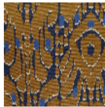
1488-04 IKATI - CAMEL