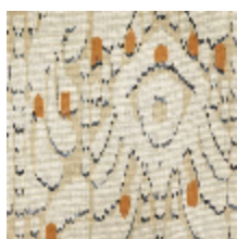
1488-01 IKATI - NATUREL