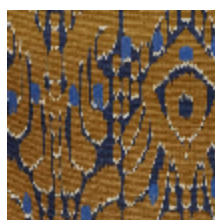
1488-04 IKATI - CAMEL