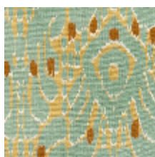
1488-03 IKATI - CELADON