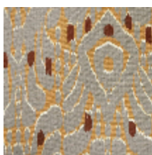
1488-02 IKATI - TOURTERELLE