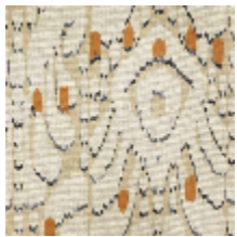
1488-01 IKATI - NATUREL