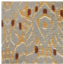
1488-02 IKATI - TOURTERELLE