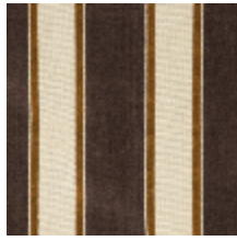
1489-03 GALERIE - TOURTERELLE