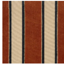
1489-04 GALERIE - TERRACOTTA