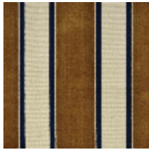
1489-02 GALERIE - CAMEL