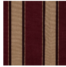
1489-05 GALERIE - GREMAT