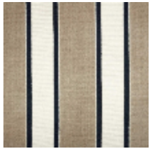
1489-01 GALERIE - NATUREL