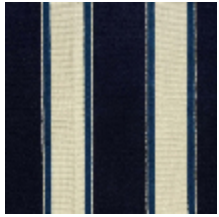
1489-07 GALERIE - MARINE