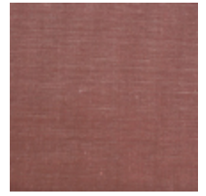
1502-06 VELOURS UNI - VX ROSE/VERT *