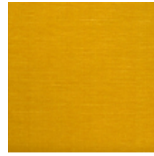
1502-05 VELOURS UNI - TOPAZE *