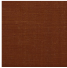
1502-08 VELOURS UNI - ECAILLE *