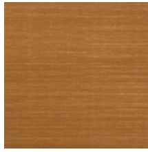
1502-03 VELOURS UNI - ISABELLE *