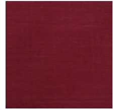
1502-12 VELOURS UNI - LILAS *