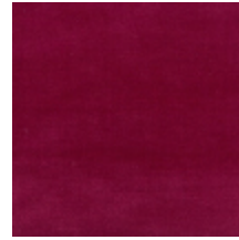
1502-11 VELOURS UNI - RUBIS *