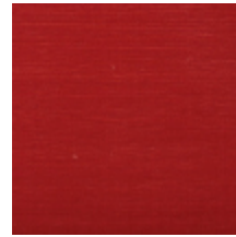
1502-19 VELOURS UNI - FEU *