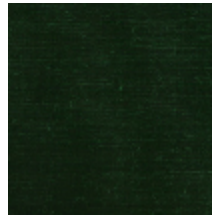
1502-18 VELOURS UNI - VERT BLEU *