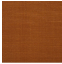
1502-04 VELOURS UNI - ORANGE *