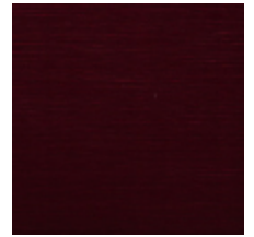
1502-20 VELOURS UNI - CRAMOISI *