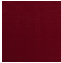
1502-10 VELOURS UNI - GIROFLEE *