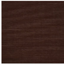
1502-01 VELOURS UNI - CHATAIGNE *