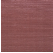
1502-07 VELOURS UNI - CYCLAMEN *