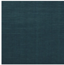
1502-15 VELOURS UNI - NATTIER *