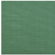
1502-14 VELOURS UNI - TURQUOISE *