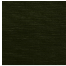
1502-17 VELOURS UNI - EMERAUDE *