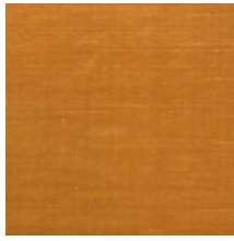
1502-02 VELOURS UNI - BEIGE *