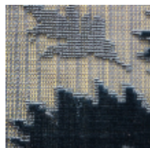
1507-01 DUCHESSE ANNE - BLEU