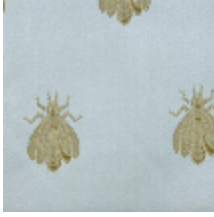
1510-01 LES ABEILLES - BLEU *