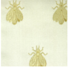
1510-02 LES ABEILLES - CREME/OR *