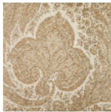
1512-03 KASHMIR - SABLE