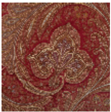
1512-01 KASHMIR - RUBIS