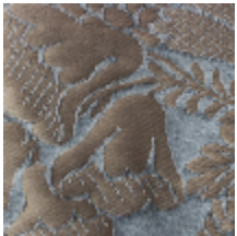
1516-01 LA COQUILLE - BLEU