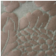
1516-15 LA COQUILLE - VERT