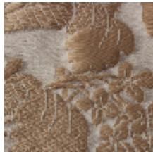
1516-28 LA COQUILLE - CREME/OR