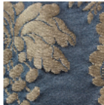
1516-40 LA COQUILLE - MARINE