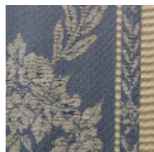
1529-01 LAURIERS - BLEU