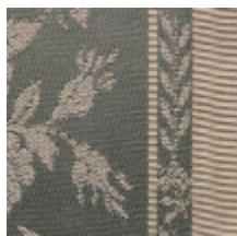
1529-05 LAURIERS - VERT