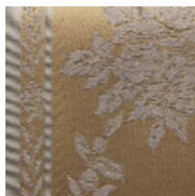
1529-02 LAURIERS - OR