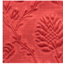
1530-30 POMMES DE PIN- RUBIS