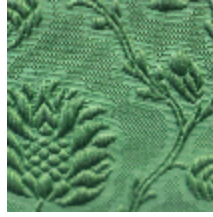
1530-15 POMMES DE PIN - VERT VIF *