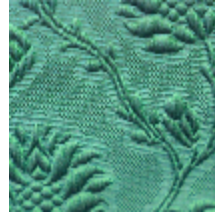
1530-16 POMMES DE PIN- VERT BLEU *