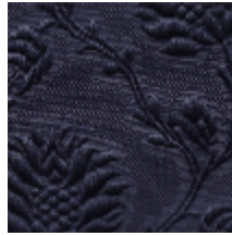
1530-28 POMMES DE PIN- ROYAL