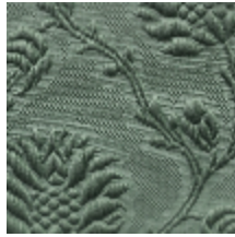
1530-25 POMMES DE PIN- SEVRES