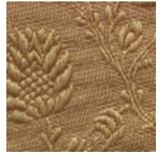
1530-34 POMMES DE PIN- OR *