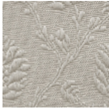
1530-21 POMMES DE PIN- PERLE