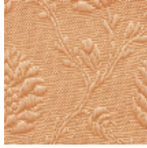
1530-08 POMMES DE PIN- FEU *