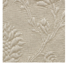
1530-20 POMMES DE PIN- IVOIRE