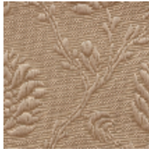
1530-23 POMMES DE PIN- PLATINE