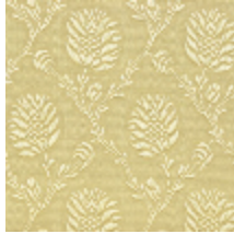
1530-03 POMMES DE PIN- CHAMPAGNE