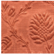
1530-32 POMMES DE PIN- AMBRE *