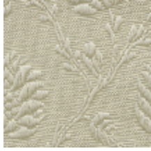
1530-01 POMMES DE PIN- CREME *