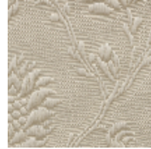
1530-20 POMMES DE PIN- IVOIRE