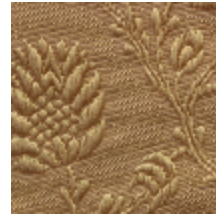
1530-34 POMMES DE PIN- OR *