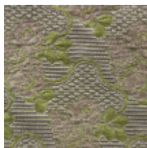
1531-04 CARMONTEL - CHARTREUSE *