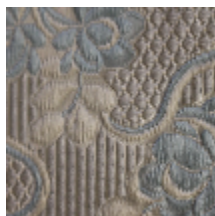
1531-03 CARMONTEL - BLEU *