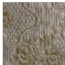
1531-02 CARMONTEL - BEIGE *