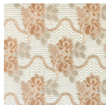
1531-01 CARMONTEL - ABRICOT *