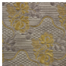
1531-05 CARMONTEL - GRIS/CREME *