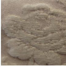
1534-03 SOPHIE CHARLOTTE- CHAMPAGNE *