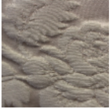
1534-01 SOPHIE CHARLOTTE- CREME *