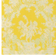
1539-03 LES AMOURS - JAUNE