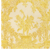
1539-02 LES AMOURS - CREME/OR