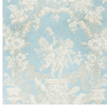
1539-01 LES AMOURS - BLEU