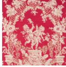
1539-04 LES AMOURS - ROUGE