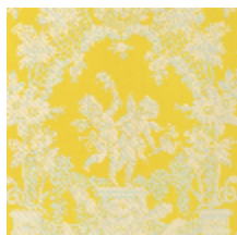
1539-03 LES AMOURS - JAUNE