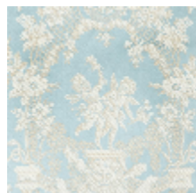
1539-01 LES AMOURS - BLEU