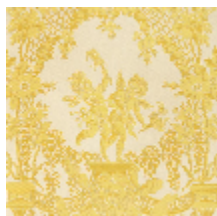
1539-02 LES AMOURS - CREME/OR