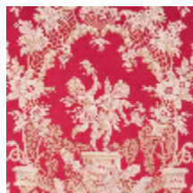
1539-04 LES AMOURS - ROUGE