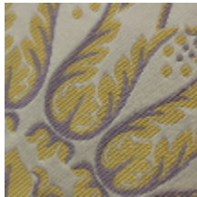
1540-02 DAVOUT S&D - CREME *