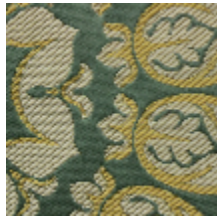
1540-05 DAVOUT S&D - VERT *