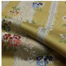
1542-03 RHEA - JONQUILLE