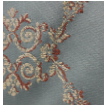
1545-04 CHARLES X - VERT