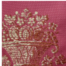
1545-03 CHARLES X - ROUGE