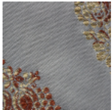
1545-01 CHARLES X - BLEU