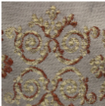
1545-02 CHARLES X - CREME