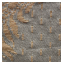
1549-27 ALEXANDRA - BLEU *