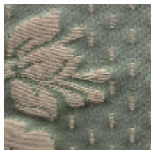
1549-15 ALEXANDRA - EMERAUDE *