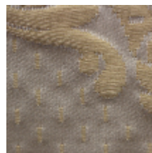
1549-28 ALEXANDRA - CREME/OR *