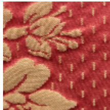
1549-26 ALEXANDRA - ROUGE/OR *