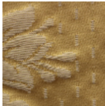
1549-20 ALEXANDRA - OR *