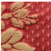
1549-26 ALEXANDRA - ROUGE/OR *