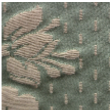
1549-15 ALEXANDRA - EMERAUDE *