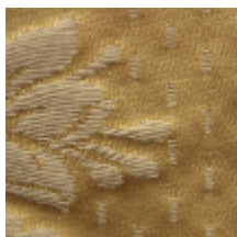
1549-20 ALEXANDRA - OR *