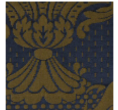
1549-40 ALEXANDRA - MARINE *