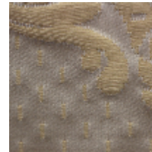
1549-28 ALEXANDRA - CREME/OR *