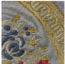
1553-01 MARIE ANTOINETTE - BLEU