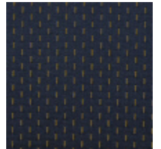
1554-40 ALEXANDRA SEME - MARINE *