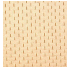
1554-28 ALEXANDRA SEME - CREME/OR *