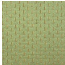
1554-15 ALEXANDRA SEME - EMERAUDE *