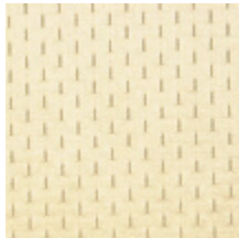
1554-01 ALEXANDRA SEME - CREME *