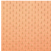
1554-07 ALEXANDRA SEME - ROSE *