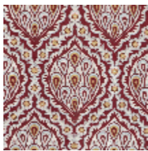
1560-01 LES GRENADES - CRAMOISI