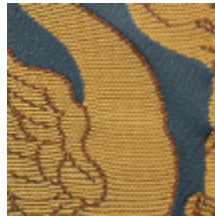
1562-06 MURAT S&D - FAIENCE