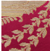
1562-04 MURAT S&D - ROUGE