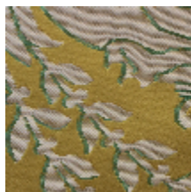
1562-03 MURAT - JAUNE