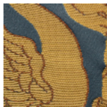
1562-06 MURAT - FAIENCE