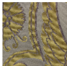
1562-02 MURAT - CREME