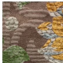
1573-06 PAIVA - TAUPE FONCE *