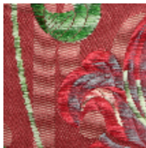
1573-04 PAIVA - RUBIS *