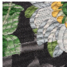
1573-07 PAIVA - NOIR