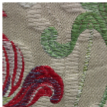
1573-02 PAIVA - BIS