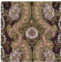
1581-02 DAHLIA PERLE - QUETSCHÉ