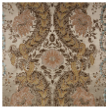
1581-01 DAHLIA PERLE - CHAMPAGNE