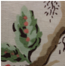
1620-02 MANDARIN BALANCOIRE - VERT