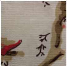
1620-01 MANDARIN BALANCOIRE - BLEU