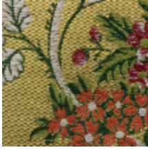
1638-02 LA FAVORITE - OR