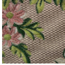
1638-04 LA FAVORITE - TAUPE *