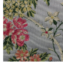
1638-05 LA FAVORITE - BLEU