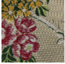
1638-01 LA FAVORITE - PARCHEMIN