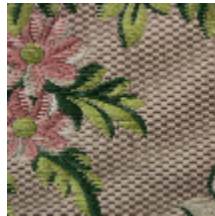
1638-04 LA FAVORITE - TAUPE *