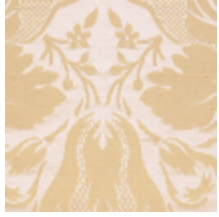
1646-02 VENTADOUR - IVOIRE