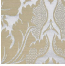
1646-03 VENTADOUR - GRIS