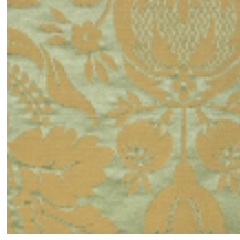
1646-05 VENTADOUR - VERT