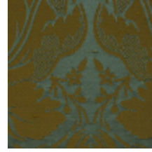
1646-09 VENTADOUR - SAPIN *