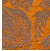
1646-08 VENTADOUR - ECAILLE