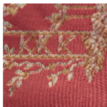
1649-04 PILLEMENT - LAQUE