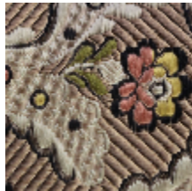
1651-03 DANCENY-BOIS DE ROSE