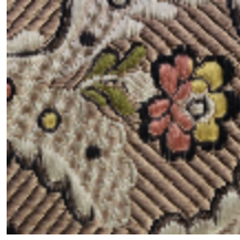
1651-03 DANCENY-BOIS DE ROSE