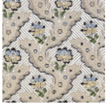
1651-01 DANCENY- IVOIRE