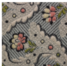
1651-02 DANCENY- PASTEL