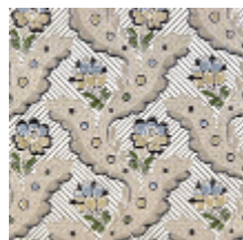
1651-01 DANCENY- IVOIRE