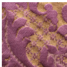
1653-01 LOUIS-PHILIPPE- POURPRE *