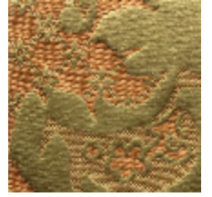
1653-05 LOUIS-PHILIPPE- CHARTREUSE *