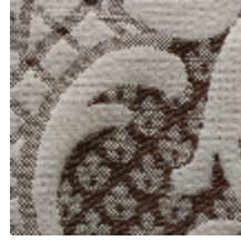
1653-07 LOUIS-PHILIPPE- ARGENT *