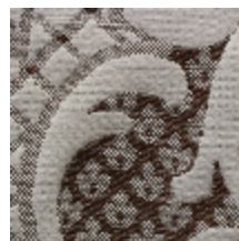
1653-07 LOUIS-PHILIPPE- ARGENT *