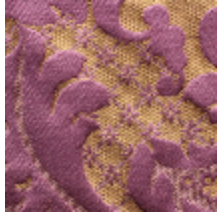
1653-01 LOUIS-PHILIPPE- POURPRE