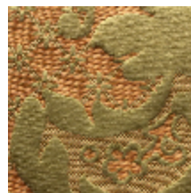
1653-05 LOUIS-PHILIPPE- CHARTREUSE *