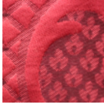
1653-02 LOUIS-PHILIPPE- RUBIS