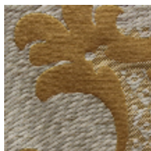
1653-04 LOUIS-PHILIPPE- OR